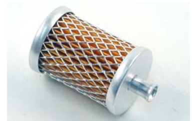
[07-241-01] 2 1/2" long

Large in-tank filter. Replaces Yamaha O.E.M. # 8H5-24560-00-00. May be used as a universal in-tank filter for other brands. 5/16" outside diameter outlet. Fits 1/4" and 5/16" inside diameter fuel line.