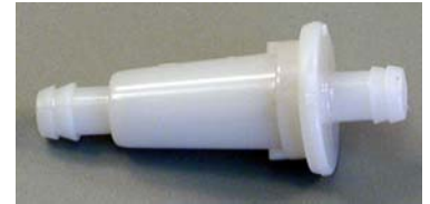
[907111, 07-244] 2" long

Sturdy nylon fuel filter. 11-12 gallons per hour capacity. Nylon screen catches all dirt particles. 1/4" outside diameter inlet and outlet. Fits both 3/16" and 1/4" inside diameter fuel line.