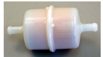
[907114, 07-246-04] 3 3/4" long

Large in line fuel filter, used in automobiles as well as in snowmobiles. Universal applications. 5/16" outside diameter inlet and outlet. Fits 5/16" inside diameter fuel line.