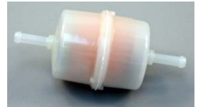
[907113, 07-246-03] 4 1/4" long

Large in-line fuel filter, used in automobiles as well as in snowmobiles. Universal applications. 1/4" outside diameter inlet and outlet. Fits both 3/16" and 1/4" inside diameter fuel line.