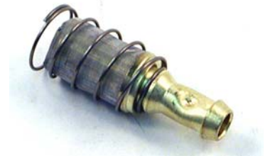
[07-241] 1 1/2" long

In-tank filter with a built-in check valve to keep gas from flowing back into the tank. 1/4" outside diameter outlet. Fits both 3/16" and 1/4" inside diameter fuel line.