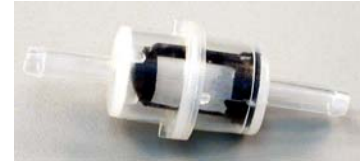
[279094, 07-245] 3" long

This is the latest design OEM filter used by Arctic Cat, Bombardier and others. A greatly improved sturdy nylon see-through filter with a larger fuel flow capacity (15 gallons per hour). 1/4" outside diameter inlet and outlet. Fits both 3/16" and 1/4" inside diameter fuel line.